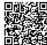
新鉅鑫贏家 變額萬能壽險