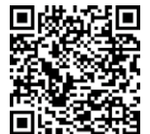
新鉅鑫贏家 外幣變額年金保險